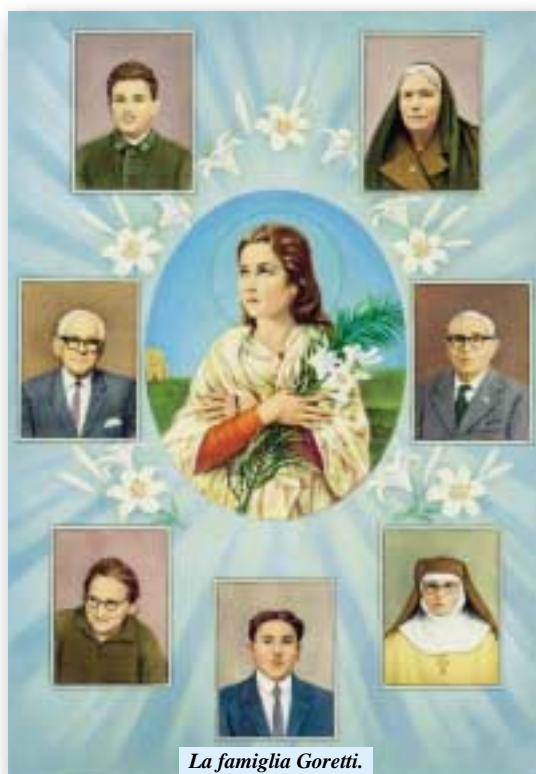
La famiglia Goretti.