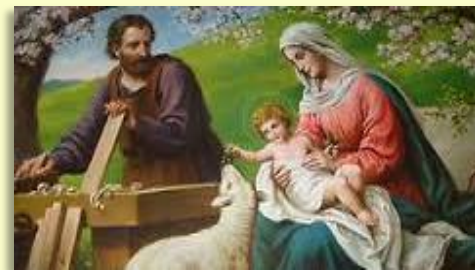
La Sacra Famiglia