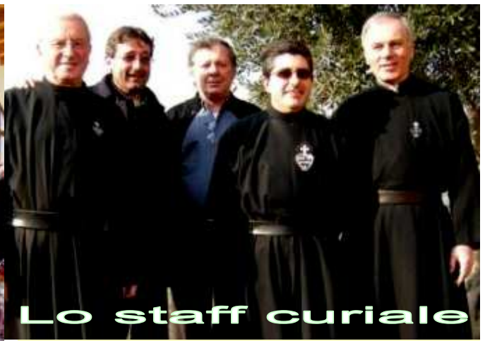
Lo staff curiale

Nella seconda settimana del mese di febbraio nel convento passionista di Caravate si è svolto il 39° Capitolo della Provincia Corm.