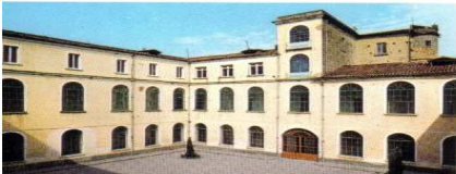
Scuola Apostolica PP. Passionisti - Calvi Risorta

ad inizio giugno ( e vi sarà comunicato) saranno pubblicate su sito dell'Aseap oltre cento fotografie del 20° Raduno degli ex alunni, tenutosi a Calvi Risorta (CE);