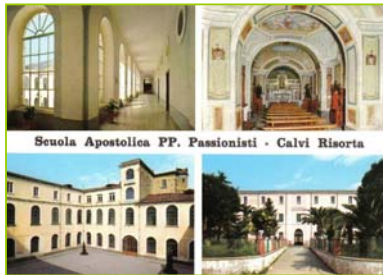
Scuola Apostolica PP. Passionisti - Calvi Risorta

loro viene spedito l'elenco completo di indirizzo della loro classe, in modo che possano contattare gli ex compagni, invogliarli e soprattutto di tenerci informati subito sulla correzione eventualmente da apportare agli indirizzi , spesso non più corrispondenti per motivo di lavoro e/o familiari.